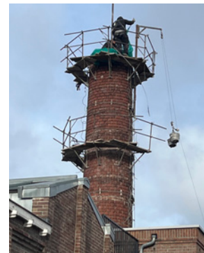
Eindelijk wordt de schoorsteen van het voormalige Posthumus-gebouw, een gemeentelijk monument, gerenoveerd.