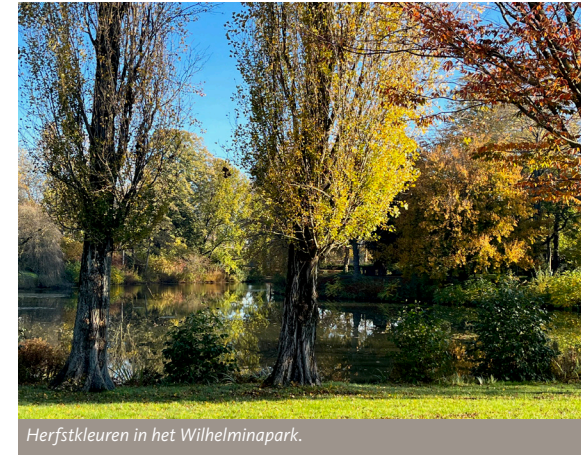
Herfstkleuren in het Wilhelminapark.