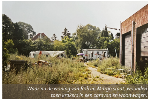
Waar nu de woning van Rob en Margo staat, woonden toen krakers in een caravan en woonwagen.

met foto's uit de periode net voorafgaand aan de werkzaamheden. Op de plaats van hun huidige woning staat nog een woonwagen en caravan waarin een aantal krakers van het toenmalige fabriekspand woonden. Rob: "De aanleg begon wel met de nodige vertraging omdat het grondwater vervuild bleek. Omdat het grondwater afloopt richting Wilhelminapark is er geen grote schoonmaak geweest, maar zekerheidshalve werd de bodem van de kruipruimten toch maar afgedekt met een laag schuimbeton. De bewoners mochten geen groenten uit eigen tuin eten en er mocht geen grondwater worden opgepompt". Uit onderzoek in 2015 in opdracht van de gemeente Breda is gebleken dat de vervuiling inmiddels is verdwenen.