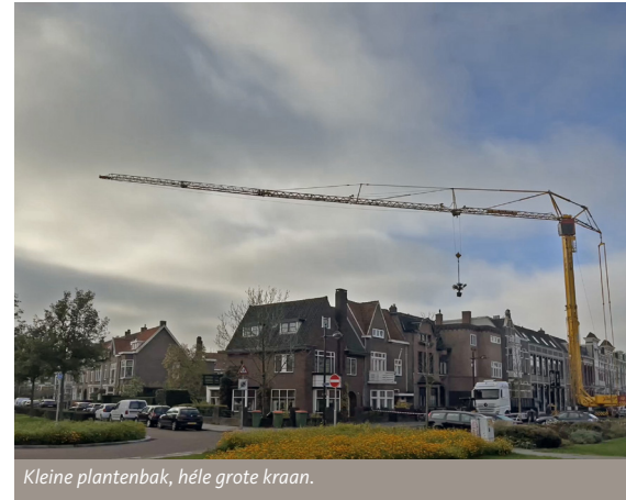
Kleine plantenbak, héle grote kraan.

projectontwikkelaar Brickfiels gaat er een kantoorgebouw van maken. Naar alle waarschijnlijkheid wordt het een accountantskantoor met op de eerste verdieping 2 appartementen.