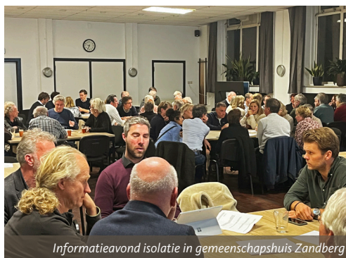
Informatieavond isolatie in gemeenschapshuis Zandberg