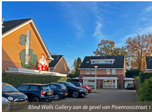
Blind Walls Gallery aan de gevel van Pioenroosstraat 1

Zo was het de vestigingsplaats van de Lonka-fabriek. Ter gelegenheid van het 100-jarig bestaan van dit bedrijf werd in 2020 een kunstwerk onthuld aan de gevel van Pioenroosstraat 1. Het kunstwerk van de hand van Mariette van der Meer is nu onderdeel van de Blind Walls Gallery tour.