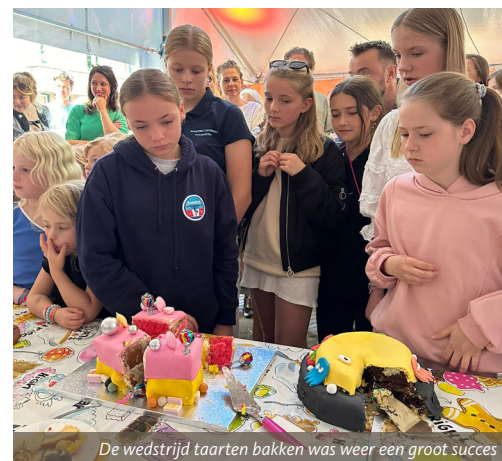
De wedstrijd taarten bakken was weer een groot succes

Ieder jaar weer barst het van de buurt- en straatfeesten, straatbbq's en straatborrels in Zandberg-Oost, vooral in de maand september, met uitzondering van het jaarlijkse buurtfeest op het Hyacintplein, dat altijd vóór de zomervakantie (dit jaar op 22 juni) wordt gevierd en de Hortensiastraat waar op zondag 25 augustus weer een straatborrel plaatsvond.